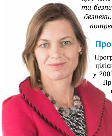
1 Посол Мерріет Шуурман, Спеціальний представник Генерального секретаря НАТО у справах жінок, миру і безпеки

“Корупція впливає на усіх нас. Ціна корупції – це не тільки наші гроші, але також втрата рівноправних можливостей і, на жаль, навіть ціна втраченого життя. Якщо ми хочемо, щоб чоловіки та жінки вносили однаковий вклад, згідно з їх повним потенціалом, до миру та безпеки, ми повинні забезпечити прозорість та інклюзивність наших інститутів безпеки, щоб вони працювали на основі професійних якостей та заслуг і відповідали потребам безпеки усього населення. Всеохоплююча безпека є кращою безпекою.” 1